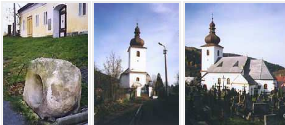
Rýžovní kámen na náměstí, kostel sv. Bartoloměje

Z Kašperských Hor sjedeme starou cestou do Rejštejna (GPS: 49°8'26"N 13°30'54"E). Na horním toku Otavy a na jejích přítocích se od pradávna rýžovalo zlato. Při rýžovištích vznikla postupem času osada Rejštejn (německy Reichenstein - Bohatý kámen). V okolí se začalo těžit zlato i z primárních ložisek hornickým způsobem. V roce 1584 se stal samostatným horním městem. V 17. století těžba zlata v okolí města končila a postupně ji začala nahrazovat rozvíjející se sklářská výroba. Roku 1836 byla založena sklárna zvaná Klášterský Mlýn . V období 1878 - 1908 to byla nejvýznamnější sklárna v Rakousku-Uhersku. Získala řadu ocenění zejména za uměleckou a technickou úroveň secesního skla. Její provoz byl ukončen v roce 1947. Mezi architektonickými památkami je nejvýznamnější kostel svatého Bartoloměje , připomínaný roku 1570. V roce 1792 byl přestavěn v barokním slohu. V cibulové báni je zavěšen gotický zvon ze 14. století.